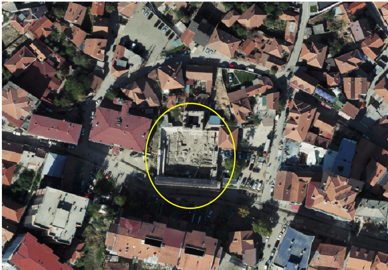
Ortofoto: - Kalaja e Vjetër/Vushtrri

Shtojcë 1: A4-Harta e lokacionit të asetit në territorin e Komunës përkatëse